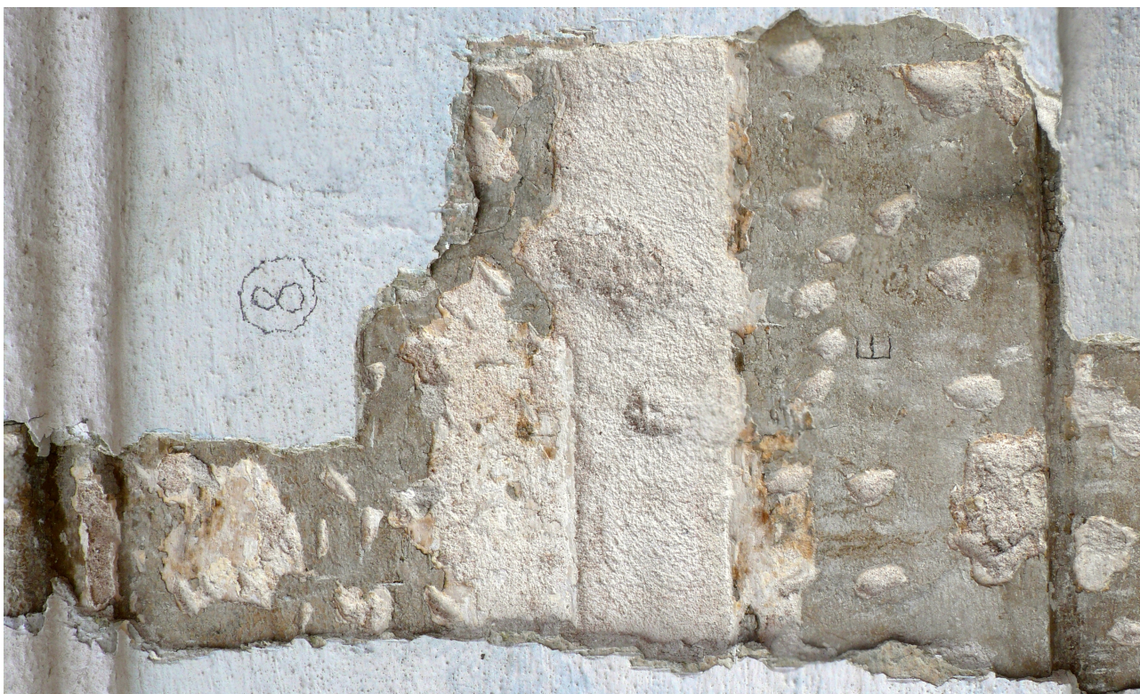
sonda 8: klasicistní vrstva na barokním štku a stopa zaniklé horizontální lizény (otočeno)