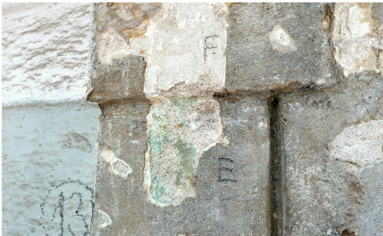
sonda 13: profil barokní omítky (ostění okna) s klasicistní vrstvou E a sondou na barokní barevnost F