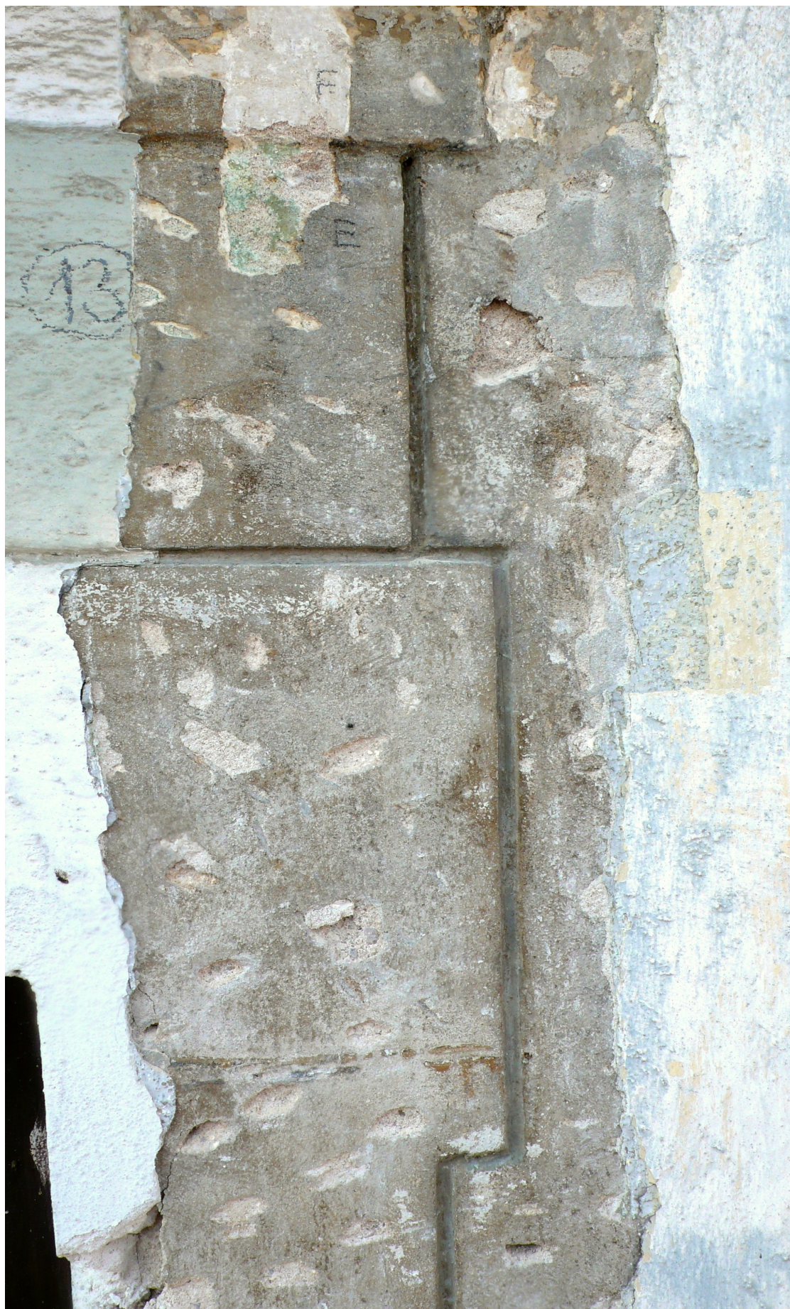
sonda 13: profil barokní omítky (ostění okna) s klasicistní vrstvou