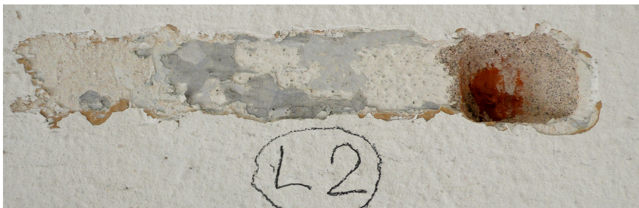
sonda L2: barokní omítky a mladší nátěry podloubí