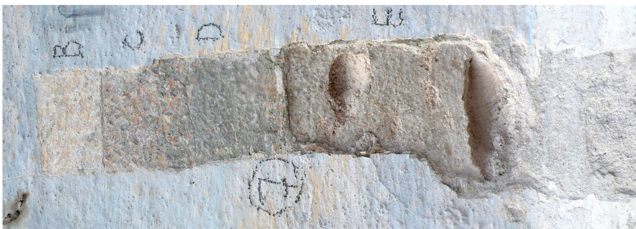
sonda 7: klasicistní vrstva a mladší úpravy (otočeno)