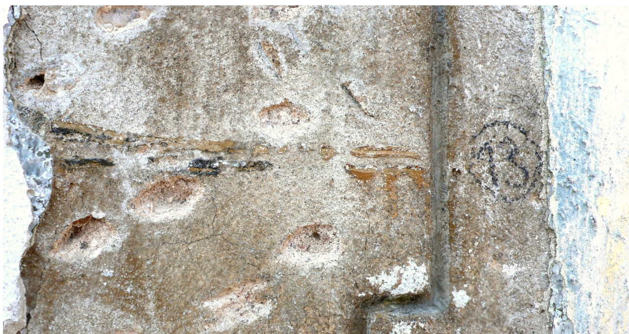
sonda 13: stopa pozdější úpravy s malovaným kvádrováním