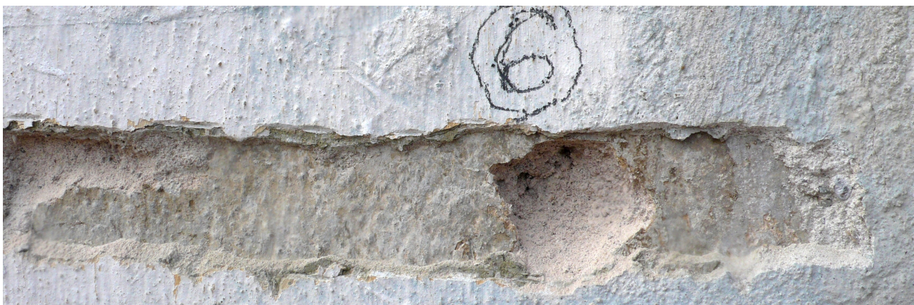
sonda 6: klasicistní vrstva