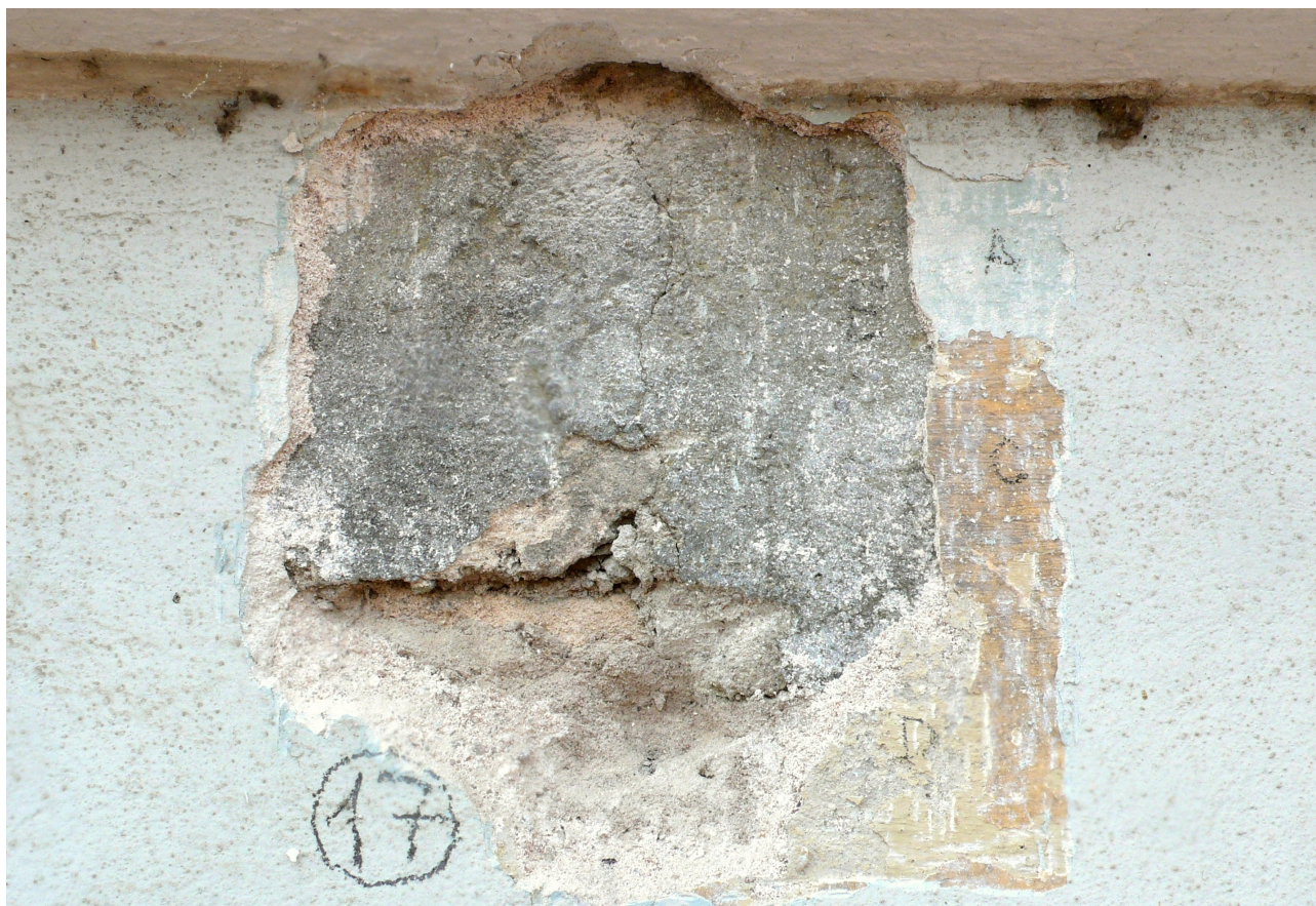
sonda 17: fragment barokní omítky v oblasti 1NP