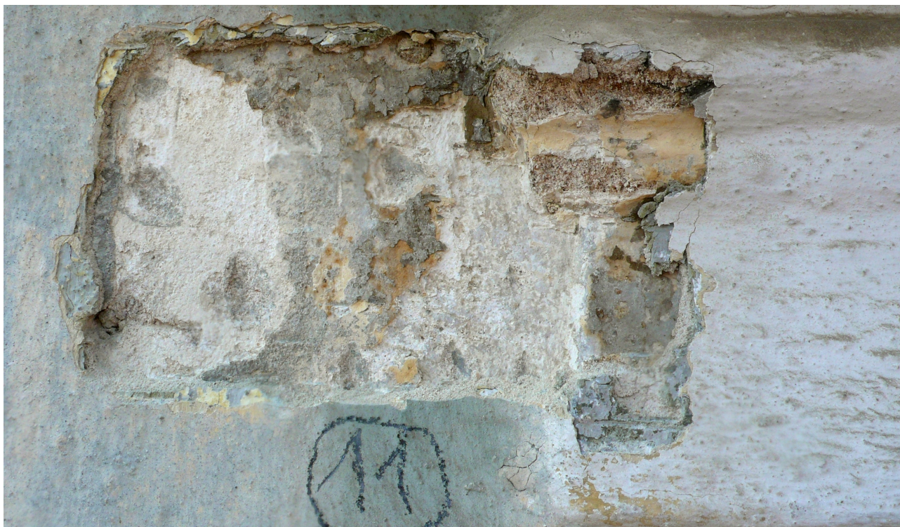
sonda 11: zbytky barokní profilace kraje nadokenní římsy