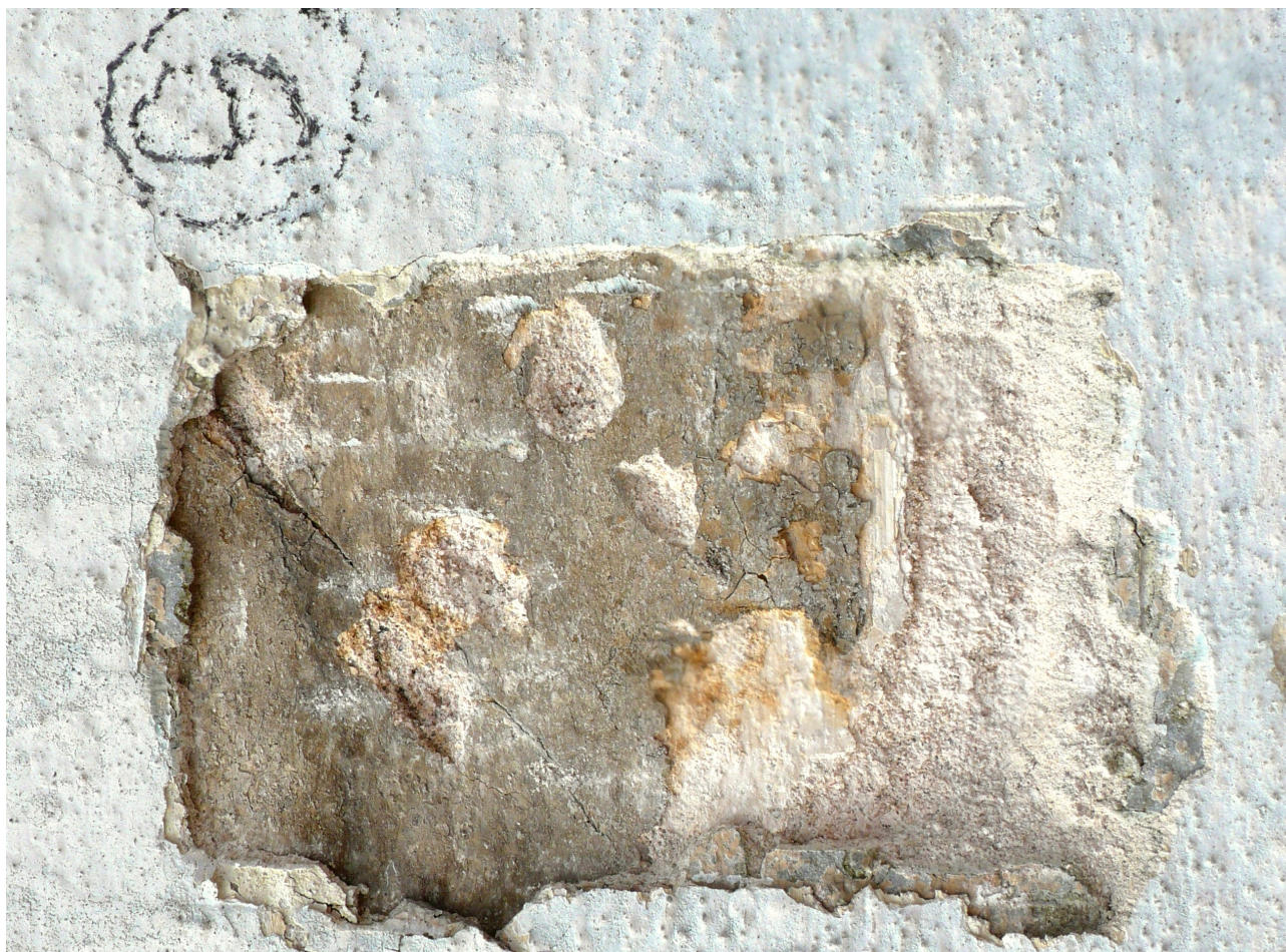
sonda 9: světlá barokní omítka s klasicistní vrstvou (otočeno)