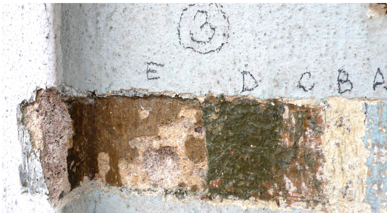
sonda 3: na klasicistní omítce hnědý nátěr E následovaný dalšími barevnými úpravami