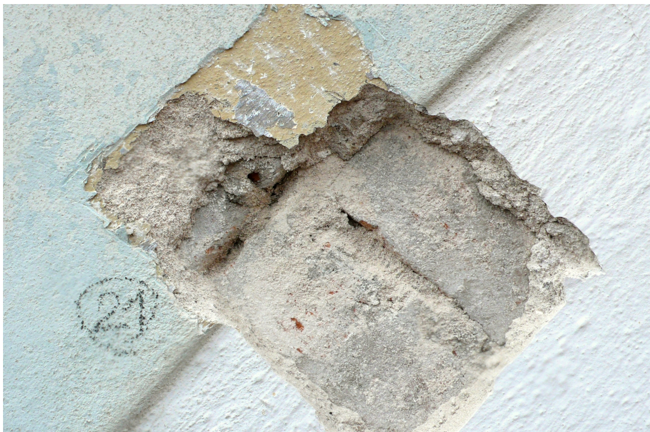
sonda 21: cihlové zdivo oblouku loubí