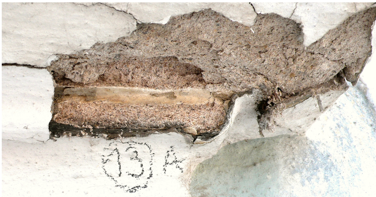
sonda 13A: stopa profilu barokní nadokení římsy