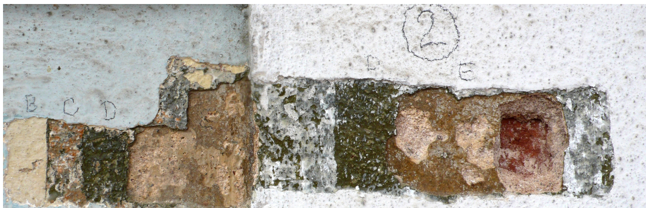
sonda 2: na klasicistní omítce hnědý nátěr E následovaný dalšími barevnými úpravami