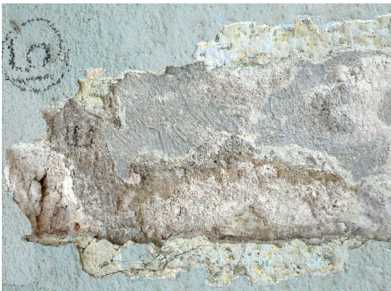
sonda 15: klasicistní vrstva E a další úpravy – na starší barokní vrstvě stopy zelené (otočeno)