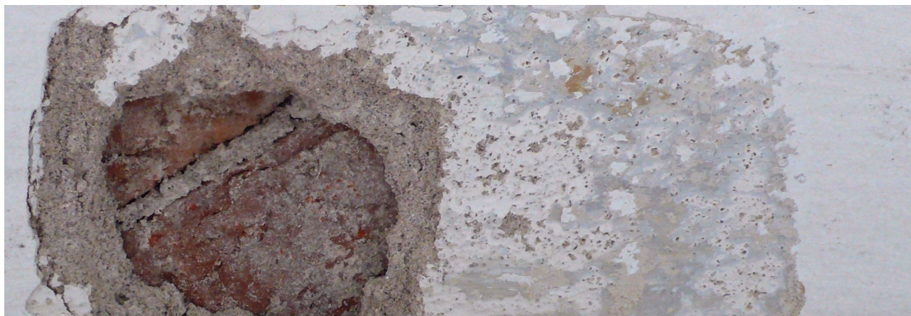
sonda L3: barokní omítky a mladší nátěry podloubí