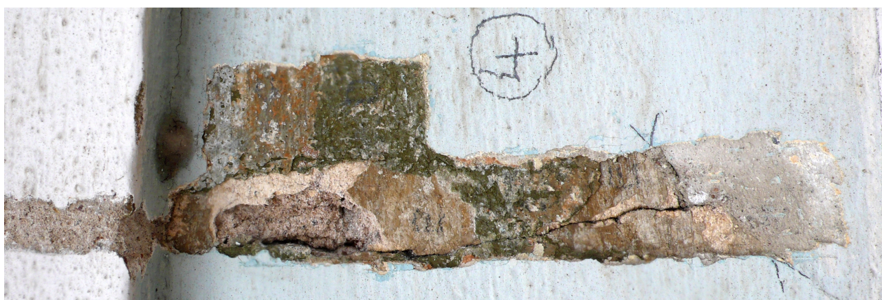
sonda 3: na klasicistní omítce hnědý nátěr E a mladší barevné úpravy, korunní římsa je novodobá, kolem oken je rovněž novodobá cementová omítka (otočeno)

(na této stránce jsou zachycené sondy zvýrazněny navlhčením)