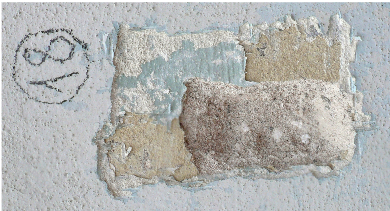
sonda 18: nátěry a štukové opravy