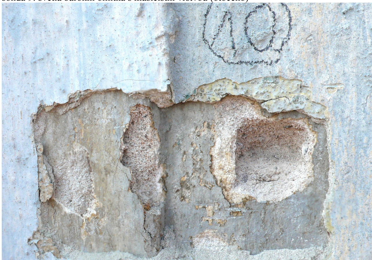
sonda 10: světlá barokní omítka s mladšími úpravami