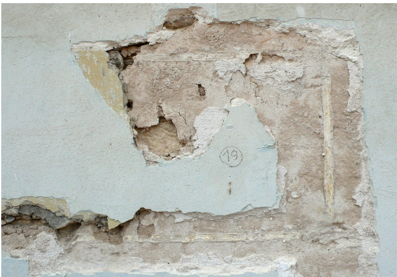
sonda 19: stopa (klasicistního) plastického bosování v oblasti 1NP cca 40x80cm bílá linka je dno žlábků – plocha z větší části odpadla