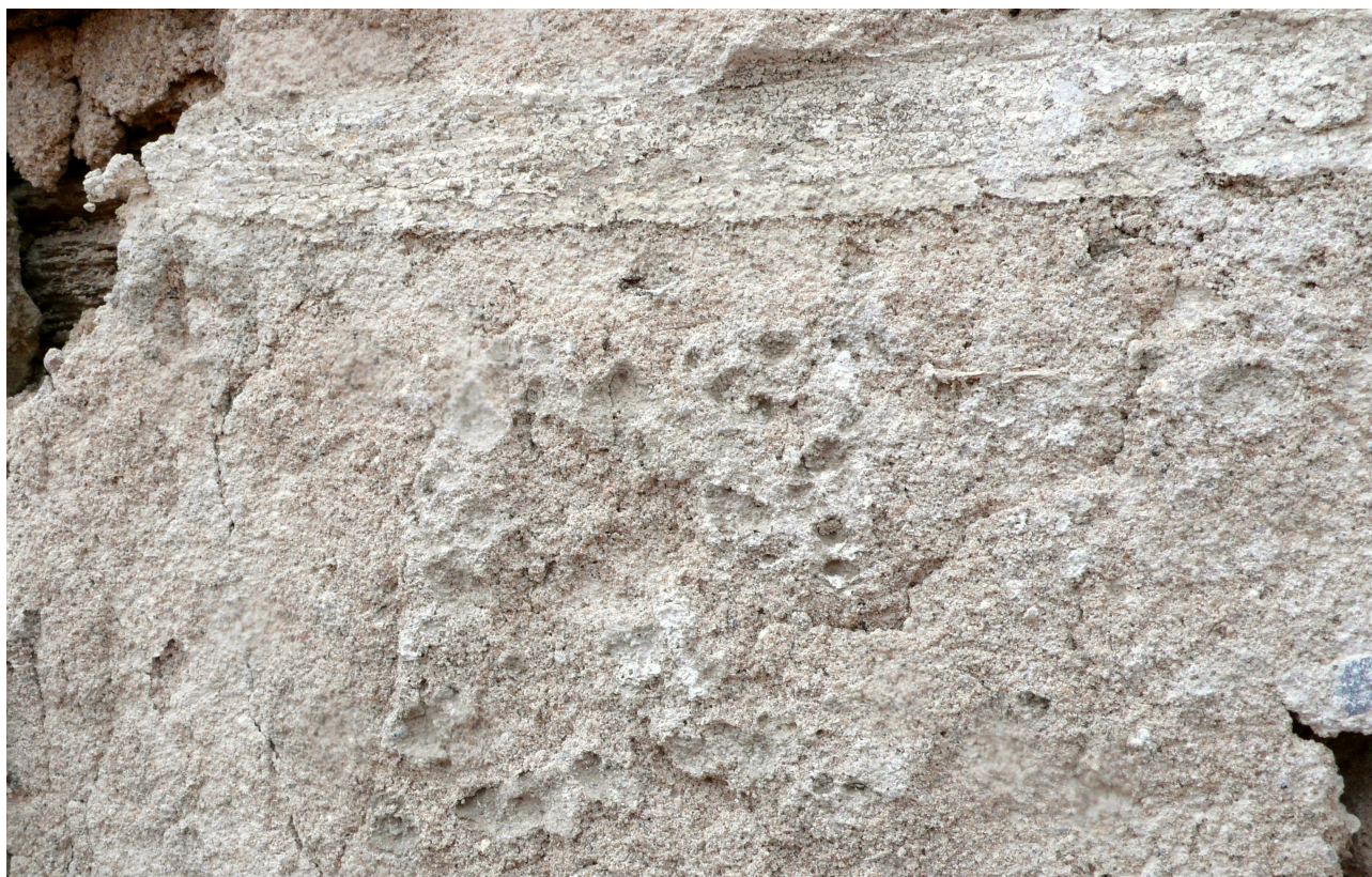
detail sondy 19: fragment povrchu bosáku napodobující pemrlovaný kámen