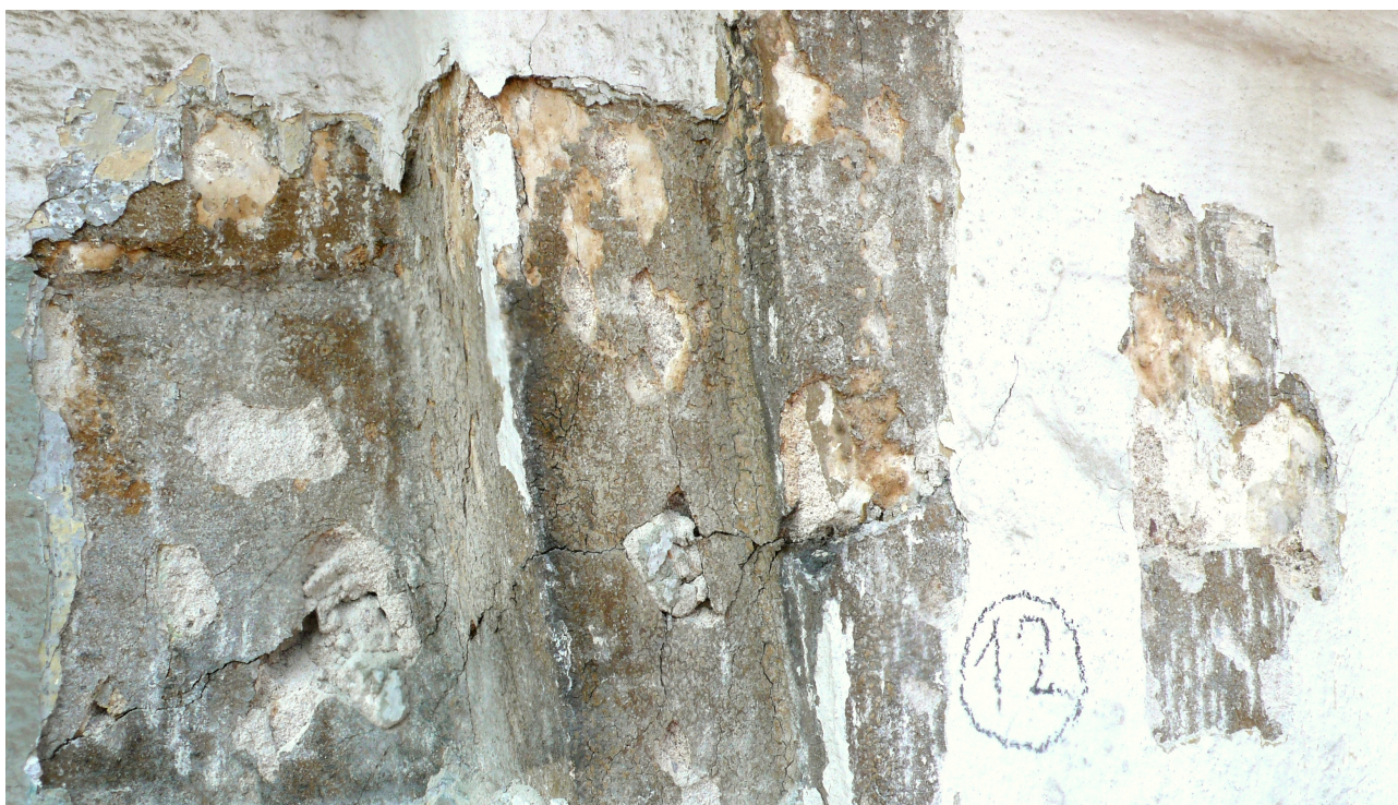
sonda 12: profil barokního klenáku s klasicistním nátěrem a pekčováním