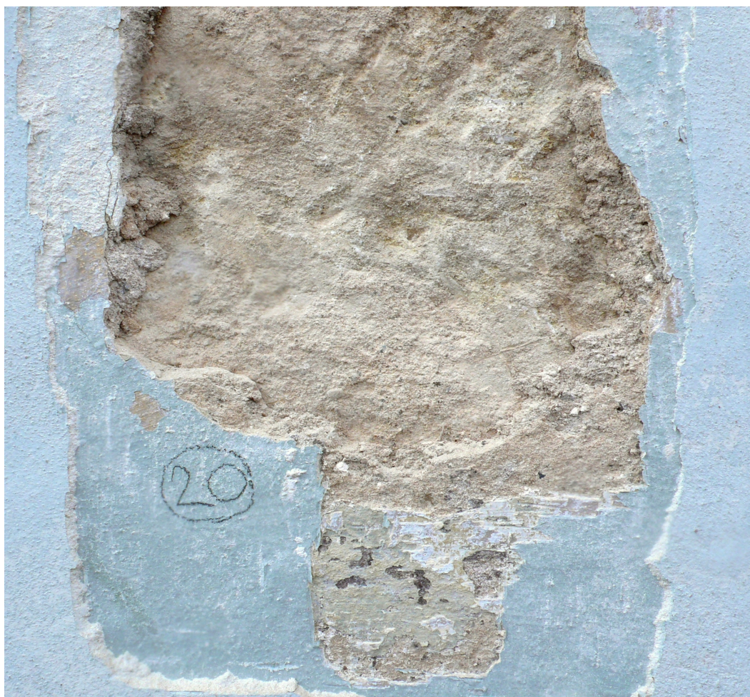
sonda 20: fragment starší (renesanční) omítkové vrstvy